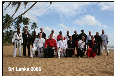
Sri Lanka 2006

Als im Jahre 1998 weitere Vereine bzw. Schulen hinzukamen entschied er sich, einen Dachverband auf ehrenamtlicher Vereinsebene zu gründen, der heute als „Deutsche Tatsu-Ryu-Bushido Kai e.V.“ bekannt ist. Im